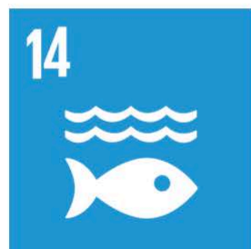
Hav och marina resurser