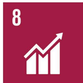
Anständiga arbetsvillkor och ekonomisk tillväxt