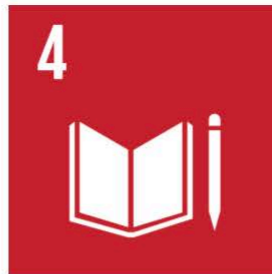
God utbildning för alla