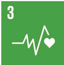
Hälsa och välbefinnande