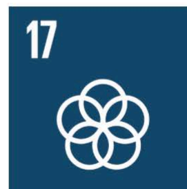
Genomförande och globalt partnerskap