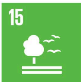
Ekosystem och biologisk mångfald