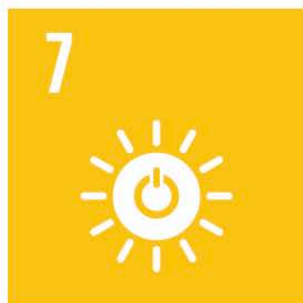
Hållbar energi för alla